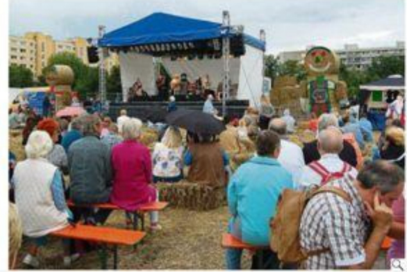
Halm im Haar: Beim Strohballenfest in Buckow spielen mehrere Bands.

Strohballen, Götter und ein falscher Fürst - was Sie am Wochenende alles anstellen können.