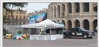
Mobilstand VENETO auf Deutschlandtour Dieses Bild im Großformat speichern

Freizeit, Buntes, Vermischtes Pressemitteilung von: Archimedes Marketing PR Agentur: Archimedes Marketing